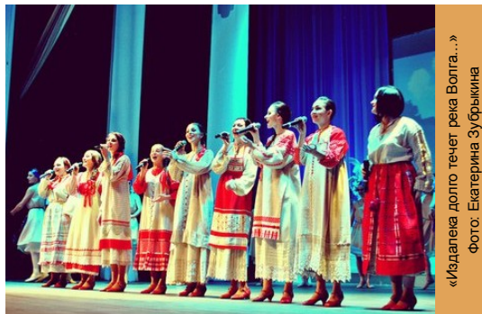
«Изданека долго течет река Волга...»

началом концерта в фойе в течение часа работал «Открытый микрофон». А уже после концерта празднование юбилея продолжилось в самом колледже, где выпускников разных лет и разных специальностей ждало много творческих сюрпризов, специально подготовленных студентами и преподавателями.